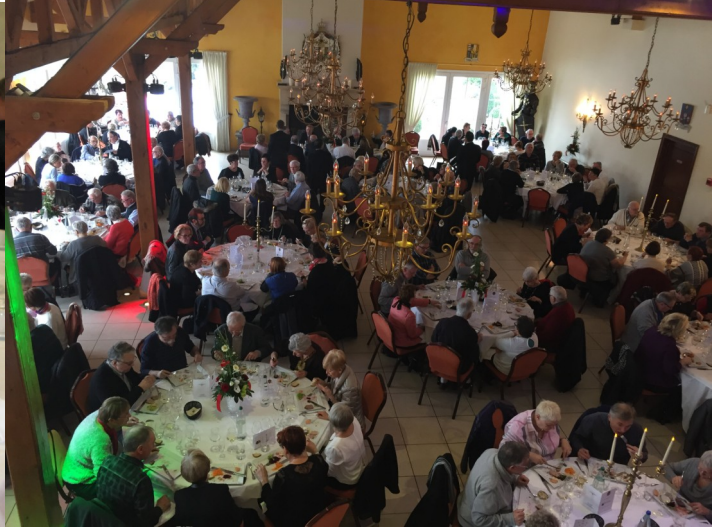
Lorraine (26 jan 2017): 173 convives à la Grange de Condé Northen.