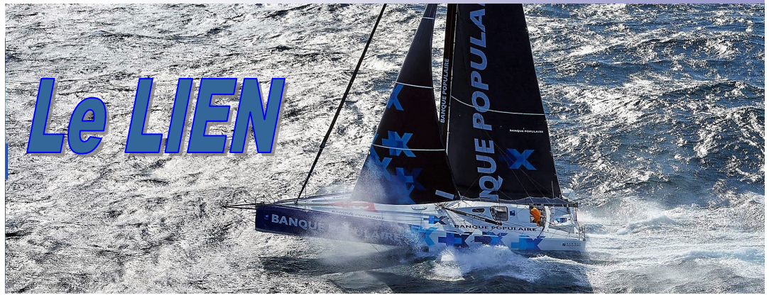
Amicale des Retraités Banque Populaire Alsace Lorraine Champagne