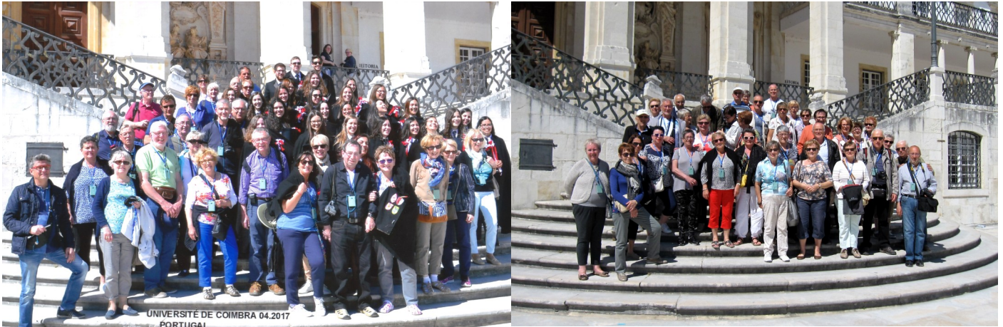
Les deux groupes sur le parvis de l'université de Coimbra, dont l'un avec un groupe d'étudiants, de passage à ce moment là.

Mercredi 03/05: le vol Luxair de mi-journée est à l'heure et nous ramène à Luxembourg où nous attendent nos taxis collectifs pour un retour au domicile par le chemin des écoliers, les grands axes étant très encombrés en cette fin d'après-midi.