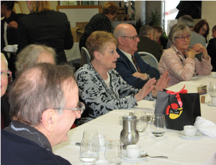
Champagne (17 jan 2017): 91 convives au Lycée Hôtelier de Troyes